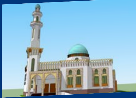
Gazze Moslem Camii