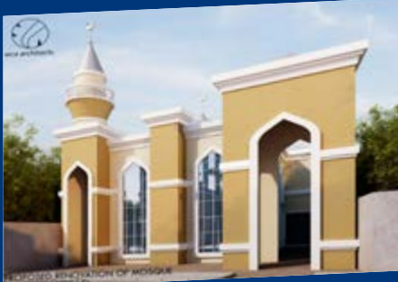
Filipinler Mabini Camii

Türkiye Diyanet Vakfı, kurulduğu 1975 yılında Kocatepe Camii tuğlalarına attığı ilk harcın ardından bugüne kadar ülkemizde 3.421, 25 ülkede de yaklaşık 50 caminin yapımına öncülük etti.