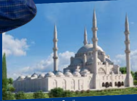
Arnavutluk Tiran Merkez Camii