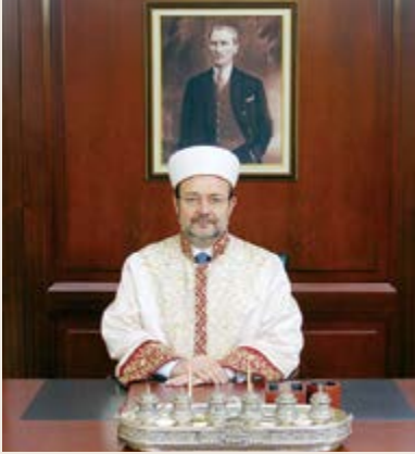
Prof. Dr. Mehmet GÖRMEZ

Diyanet İşleri Başkanı ve TDV Mütevelli Heyeti Başkanı