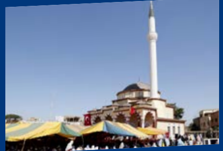
Mali Bamako Eyüp Sultan Camii

ilçeler ile köyleri camilerle süslediğini vurguladı.