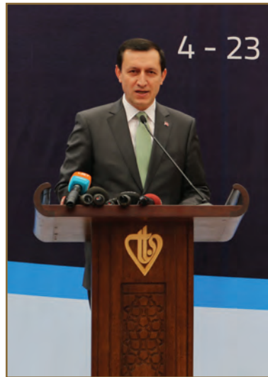
Prof. Dr. Emrullah İŞLER Başbakan Yardımcısı