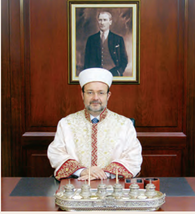
Prof. Dr. Mehmet GÖRMEZ

Diyanet İşleri Başkanı ve TDV Mütevelli Heyeti Başkanı