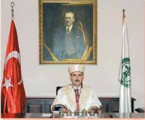
Prof. Dr. Ali BARDAKOĞLU Diyanet İşleri Başkanı ve TDV Mütevelli Heyeti Başkanı