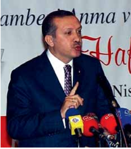
Recep Tayyip Erdoğan Başbakan

R ahman ve Rahim olan Allah'ın adıyla. Alemi aydınlatan bir Kutlu Doğumu hatırlamak ki Sayın Başkanımızın ifade ettiği gibi, sevgili Peygamberimizi anma ve anlama ifadesi gerçekten çok güzel ve yerinde tespitti. Asırlardır ruhumuzu besleyen, gönüllerimizi ilk günkü gibi heyecanlandıran bir müjde ile tazelenmek üzere bir arada bulunuyoruz. Bu beraberliğimizin birliğe, esenliğe, huzura vesile olmasını Allah'tan temenni ediyorum.