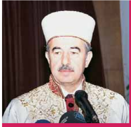
Prof.Dr. Ali BARDAKOĞLU Diyanet İşleri Başkanı Türkiye Diyanet Vakfı Mütevelli Heyeti Başkanı

Panelin açış konuşmasını Diyanet İşleri Başkanı ve Türkiye Diyanet Vakfı Mütevelli Heyeti Başkanı Prof.Dr. Ali Bardakoğlu yaptı.