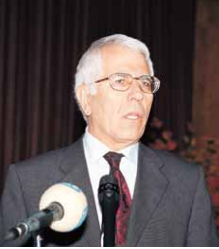
Prof.Dr. Mehmet Aydın Devlet Bakanı

B aşıktanda anlaşıldığı gibi, bu seneki değişiklik, İslam'ın evrensellğine dair bir konunun yeniden vurgulanmasıyla ilgili. Çünkü İslam'ı öteki dinlerden ayıran, Hz. Peygamberimizi o peygamberler zinciri içinde nev-i şahsına münhasır yere koyan bir özellik var. O da şu; aslında İslam'ı tanımak, vahiy zincirinin son halkasını tanımak, geriye doğru giden bir evrenselliği ortaya çıkarıyor. Yani bütünüyle doğuşundan, Resulullah'a gelinceye kadar, İslam'ın doğuşuna gelinceye kadar, o tarihi vahiy tarihini, evrenselliği içinde, geriye doğru uzanan evrenselliği içinde anlamak manasına geliyor. Hz. Peygamberi tanımak, bir anlamda bütün peygamberleri özü itibarıyla tanımak anlamına geliyor. Çünkü İslam son dindir, çünkü hak dindir, dolayısıyla o akıp gelen ırmağın bütün hikmeti o noktada buluşmakta, o noktada adeta insanlığa artık yeter, bu ışıqla sen aklını kullanarak, bilgini kullanarak kendi kendini yönetebilecek duruma geldin, artık yoluna devam etmek zorundasın gibi uyarı bir ihtar var.