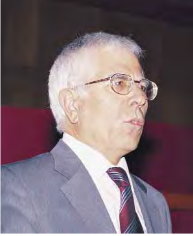
Prof.Dr. Mehmet AYDIN Devlet Bakanı

K urumların bir bakıma kişilere benzediğini ve organize varlıklar olduğunu ifade eden Devlet Bakanı Prof.Dr. Mehmet Aydın, kurumların kendileriyle ve çevreleriyle sürekli ilişkileri bulunduğunu ve onların da bir bakıma bir tür seleksüyona tabi olduklarını söyledi. Bu bakımdan kurumların hizmetlerini ifa edebildikleri ölçüde yaşayabileceklerini belirten Prof.Dr. Mehmet Aydın, “Eğer gördükleri hizmeti görmeye devam edebilirlerse ve bu hizmet yeterli olursa işlevsel olmaya devam ederlerse ve bunu da büyüterek, zenginleşerek yapmayı sürdürürlerse ve yine hayatın öteki dokularıyla irtibatlarını devam ettirirlerse; yaşarlar, yaşamaya devam ederler; ettiremezlerse ya yok olup giderler, yahut var ama yok kabilinden bir duruma düşerler. Bu bakımdan bu seleksiyon dediğimiz şey, aslında hayatın çok önemli bir kuralı şeklinde devam edip gidiyor.” dedi.