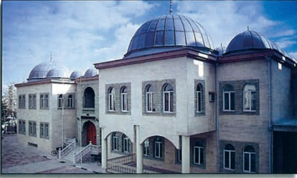
Konya Müftülük Sitesi