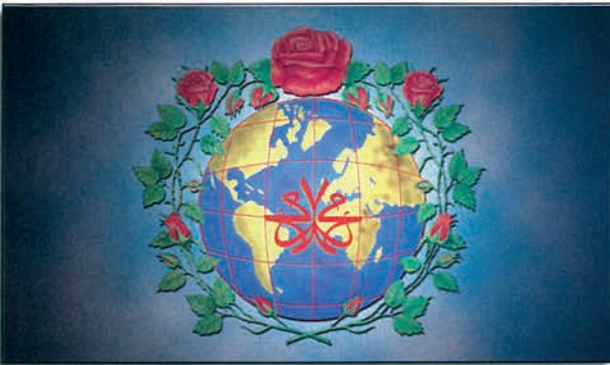
Kutlu Doğum Haftası

Türkiye Diyanet Vakfı; dinî, sosyal ve kültürel hizmetlerin uygun mekanlarda yapılması gerektiği gerçeğinden hareketle, gerekli alt yapı çalışmalarını yapmış ve müftülüklerimizi, onuruna yaraşır binalara kavuşturmuştur.