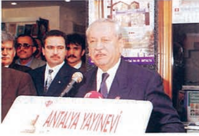
• Osman MÜDERRİSOĞLU Antalya Milletvekili

Törende bir konuşma yapan Antalya Milletvekili Osman Müderrisoğlu da Antalya'ya kazandırdıkları bu müesseseden dolayı Türkiye Diyanet Vakfı'na teşekkür ederek sözlerine başladı.