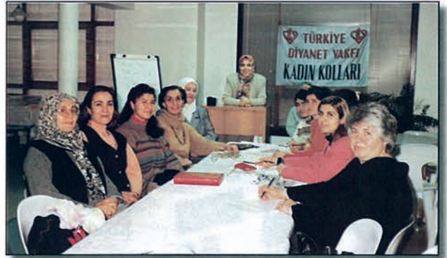
Kadın Kolları Toplantı Halinde