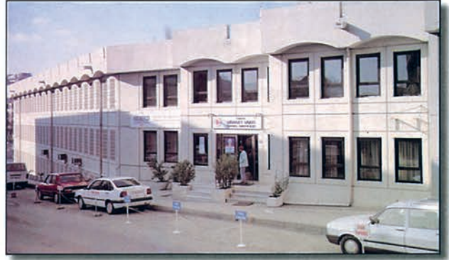
Türkiye Diyanet Vakfı Merkez Binası

Türkiye Diyanet Vakfı ; Diyanet İşleri Başkanlığına yürütülen Hac organizesinde önemli hizmetler üstlenmektedir. Hac ibadetinin eksiksiz yerine getirilmesi ciddi bir organizasyonu zorunlu kılmaktadır. Türkiye Diyanet Vakfı bu alanda da önemli hizmetler vermektedir.