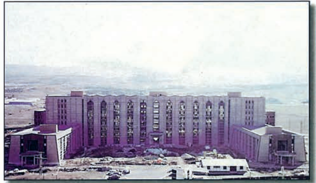
Diyanet İşleri Başkanlığı Hizmet Binası İnşaatı