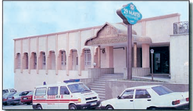
29 Mayıs Hastanesi