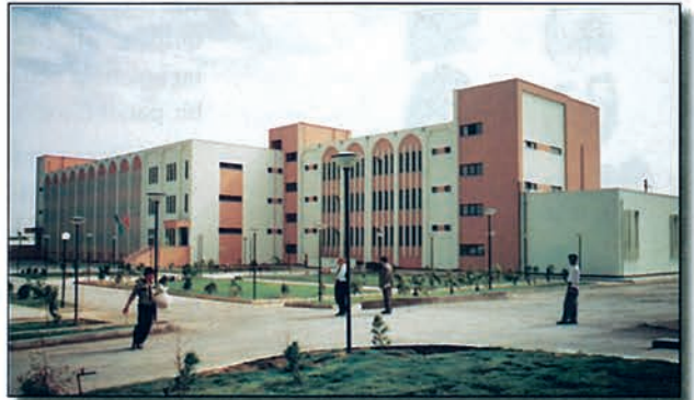
Türkmenistan İlahiyat Fakültesi