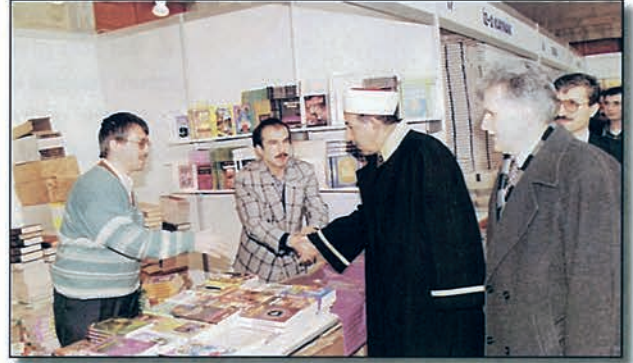
Dini Yayınlar Fuarı

Anahatlarıyla belirtilen bu hizmetler Türkiye Diyanet Vakfı tarafından ihtiyaçlar ve bütçe imkanları gözönünde tutularak aynı zamanda devletimizin iç ve dış politikasına uygun olarak yürütülmektedir.