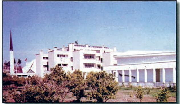
Antalya Eğitim Merkezi