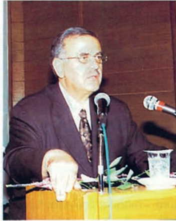
Devlet Bakanı Mehmet Keçeciler konferansın açılışında konuşma yaparken.