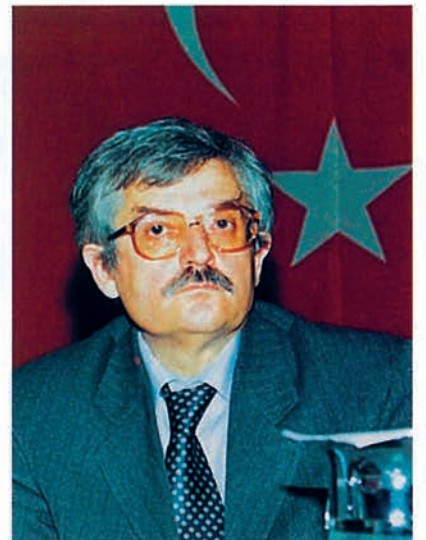
Prof.Dr. Korkut Tuna

Dinin toplumsal yaşantı içinde önemli bir yeri olduğunu belirterek tebliğine başlayan Prof.Dr. Korkut Tuna "İnsanlığın örgütlü bir toplum yapısı içinde varlığını sür-