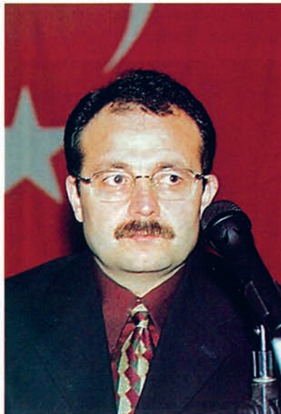
Dr. Mehmet Görmez

İ lahi öğretilerin Peygamberlerin örneklikleri üzerine bina edildiğini belirterek tebliğine başlayan Dr. Mehmet Görmez “İlahi öğretiler ile beşeri ideolojiler arasındaki en temel farklardan birisi ilahi öğretilerin yaldızlı teoriler üzerine değil, ilahi muallimlerin, yani peygamberlerin örneklikleri üzerine bina edilmiş olmalarıdır.” dedi.