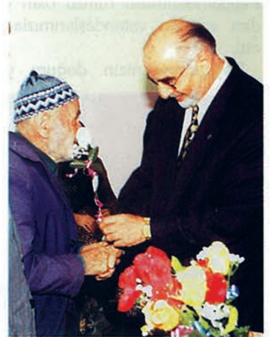
Konya Huzurevi sakinleri ile sohbet ve Gül takdimi