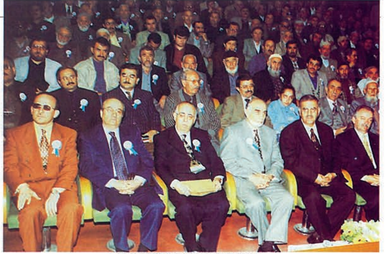
Protokol ve Misafirlerden görünüm.