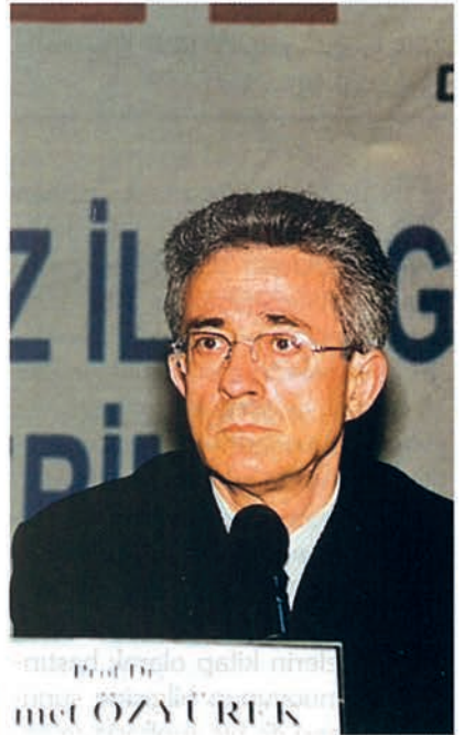
Prof.Dr. Mehmet Özyürek

özür, insanla birlikte gelmiyor aslında. Yüce Allah, insanları yaratırken, onların özrünü ve yetersizliğini birlikte getirmiyor, farklılığını getiriyor. Sonradan, insanlar, bu yetersizliği ve özrü oluşturuyorlar. Nasıl oluşturuyorlar diye bakarsanız; kurmuş oldukları toplumsal kurumlar aracılığıyla, toplum düzeniyle oluşturmuş oluyorlar. Eğer, o toplumsal kurumlar, toplumsal düzenlemeler, o insanların da toplumda yaşamlarını sürdürmelerine imkân verecek şekilde olacak olursa, ne yetersizlik olur, ne özür olur.” dedi.