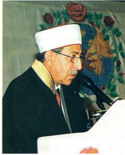
Mehmet Nuri Yılmaz Diyanet İşleri Başkanı ve Türkiye Diyanet Vakfı Mütevelli Heyeti Başkanı

Y ıllardan beri Zat-ı Risalet-penahi'yi; onun insanlığa bıraktığı manevi mirasın çeşitli boyutlarıyla ele alındığı; "Kutlu Doğum Haftaları"ndan bir yenisini daha gerçekleştirerek bunu ihya etmenin mutluluğu içinde hepinizi saygı ve sevgilerimle selamlıyorum. Üçüncü bin yılda İslam dininin çeşitli yönleriyle işleneceği bu yılki programımızın tesirli ve feyizli olmasını, kainatın