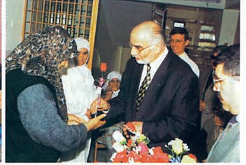
Konya Huzurevi sakinleri ile sohbet ve Gül takdimi