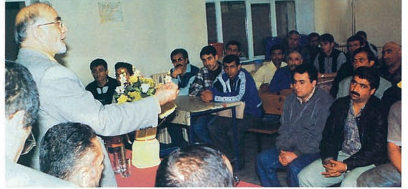
Konya Yarıcaık Cezaevi Mahkumları ile sohbet ve gül takdimi