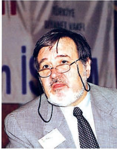
Prof.Dr. İlber Ortaylı

E sas itibariyle bugünkü mevzumuz, "Üçüncü 1000'e Girenken İslâm'ı Anlamak"tır. Zaman, bir referans meselesidir, bir demirleme meselesidir. Üçüncü 1000, kullandığımız takvim icabıdır. Bunun çok anormal bir değişim, büyük bir milenyum olmadığı da açıktır, olaylar da bunu gösteriyor, hiçbir şey fark etmiyor. Dolayısıyla, bunu bir zaman olarak anlıyoruz. Dünya, üçüncü 1000'e girerken büyük bir değişikliğe giriyor değil aslında; yorumlar öyle, ama bazı olaylar tabii ortamı değiştirdi bizim için.