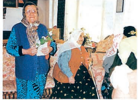
TDV Kadın Kollarımız tarafından, Gül Günü'nde kimsesiz ve yaşlı insanlar ziyaret edilmiştir.

Özetlemek gerekirse, Kutlu Doğum Haftası'nın amblemindeki gül, sadece peygamberimizi değil, aynı zamanda olağanüstü zenginlikteki bir kültürü ve kültürün mayasındaki derin sevgiyi ifade etmektedir.