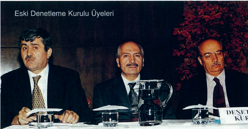
Eski Denetleme Kurulu Üyeleri

Tekrar katıldığınız için teşekkür ediyor, hepinize sevgiler saygılar sunuyorum.