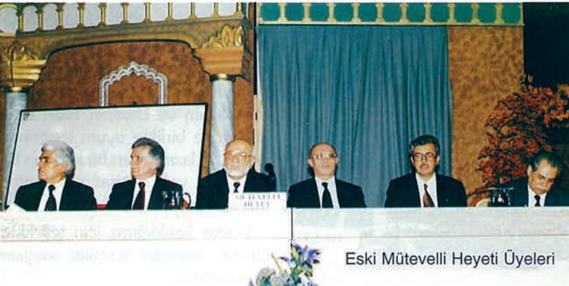
Eski Mütevelli Heyeti Üyeleri

Son zamanlarda hepinizin bildiği gibi Vakıf kitapları hakkında basında bazı olumsuz yazılar çıktı. Tabi Vakfın bir çok yayınları var. Bu yayınları içerisinde bir kaç tane hoş gitmeyen veya yoruma muhtaç kitaplar olabilir. Bu konuda da gerekli tedbirin alınması, kitapların Diyanet İşleri Başkanlığı ve üniversitedeki değerli ilim adamları tarafından incelenmesi, onların raporlarına istinaden yayınlanması bizim arzumuzdur, temennimizdir ve Mütevelli Heyet de o konuda zannedersem karar almıştır. Bu karar titizlikle uygulanmalıdır.