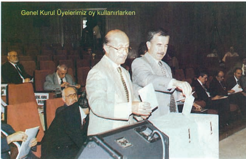
Genel Kurul Üyelerimiz oy kullanırlarken