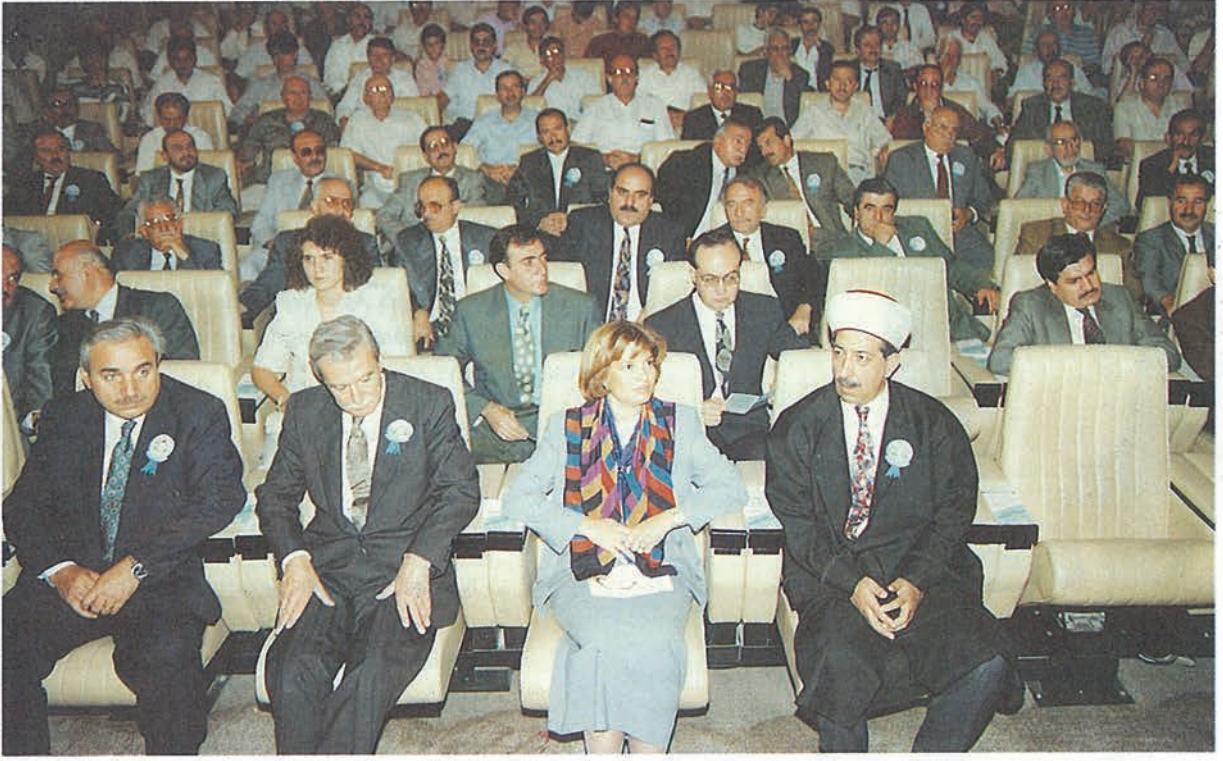
Kutlu Doğum Haftası açılış törenine büyük ilgi gösterildi.