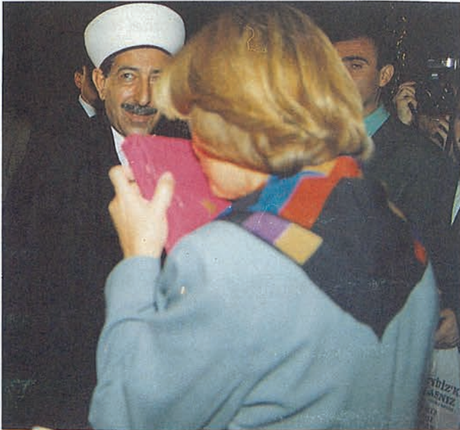
Diyanet İşleri Başkanı ve Türkiye Diyanet Vakfı Mütevelli Heyeti Başkanı Mehmet Nuri Yılmaz, Başbakan Tansu Çiller'e Kur'an-ı Kerim hediye etti.