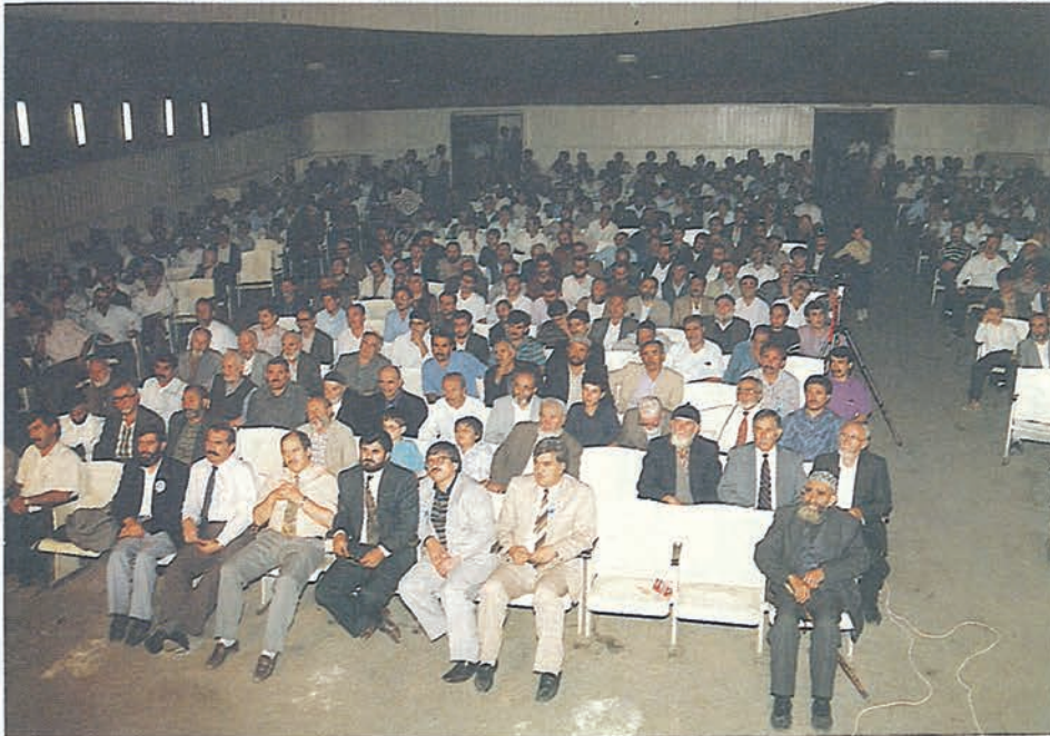
Yozgat Müftülüğünde düzenlenen panel izleyicilerin ilgisini çekti.