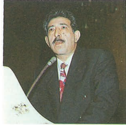
Diyanet İşleri Başkanı ve Vakfımız Mütevelli Heyeti Başkanı Mehmet Nuri Yılmaz

Son olarak kürsüye gelen Diyanet İşleri Başkanı Mehmet Nuri YILMAZ, yeni seçilen Mütevelli Heyeti adına Genel Kurula ve kendilerinden önceki Mütevelli Heyetine teşekkür etti. Başkanlık ve Vakıf işbirliğinin önemini belirterek "Diyanet İşleri Başkanlığı ile Türkiye Diyanet Vakfı birbirinin lazım ve melzumu haline gelmiştir. Birinin varlığı diğerinin varlığını gerektirir. Diyanet Vakfını Başkanlığımız ayakta tutmaktadır. Diyanet hizmetlerini de Vakfımız desteklemektedir." dedi. Her zaman kendisinin Vakfa sıcak baktığını, bu hususta söylenenlerin hiç birisine iltifat etmediğini, Mütevelli Heyetin hepsinin hüsnüniyet sahibi ve Allah'tan korkan kimseler olduklarına inandığını, elbirliğiyle Vakfı daha ileri götürmeye, daha yüceltmeye çalışılması gerektiğini ve Vakfın hizmetlerinin her vesile ile dile getirilmesini; Diyanet İşleri Başkanlığı hizmetleri için Devletin bütçeden ayırdığı ödeneğin yetmediğini, her hususta bu büyük teşkilatın Başkanlığa yardımcı olduğunu ve olacağını ifade ederek, "Ben her zaman Vakfa sıcak bakmışımdır. Bu hususta her zaman birşeyler söylenmiştir. Dinimizde sui zan haramdır. Ülkemizde Türkiye Diyanet Vakfı'nın gerçekleştirdiği faaliyetleri hepimiz bilmekteyiz. Elbirliği ile Türkiye Diyanet Vakfı'nı daha ileriye götürmeye çalışmalıyız. Devlet tarafından Diyanet İşleri Başkanlığı'na hizmetlerin yürütülmesi amacıyla bütçe ayrılmaktadır. Ancak ayrılan bütçe bize yetmemektedir. Türkiye Diyanet Vakfı'nın gücü ile hizmetlerimizi daha iyi yürütmekteyiz." dedi.