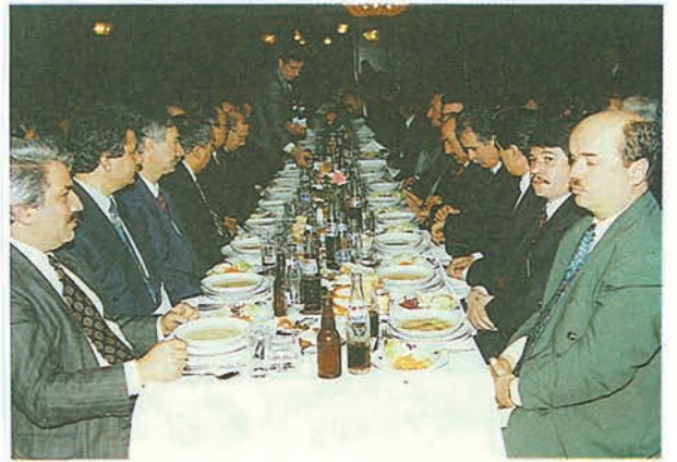
Yemeğe katılan çeşitli kurum ve kuruluş yöneticileri ile basın mensupları.