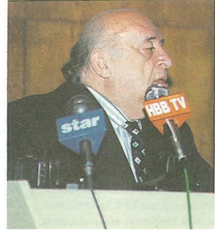
Başbakan Süleyman Demirel

Başbakan Süleyman Demirel, özetle dünyada 179 tane devletin olduğunu, hiç bir ülkenin yalnız başına hareket etmediğini, haklı bulunduğunuz davalarda haklı kalarak yola devam edilmesi gerektiğini, çoğu İslâm ülkesinin batı ile çok daha yakın ilişkiler içinde olduğunu belirterek “Dünya ile beraber olurken, Batı ile beraber olurken ne bizim Müslümanlığımıza hanel gel-