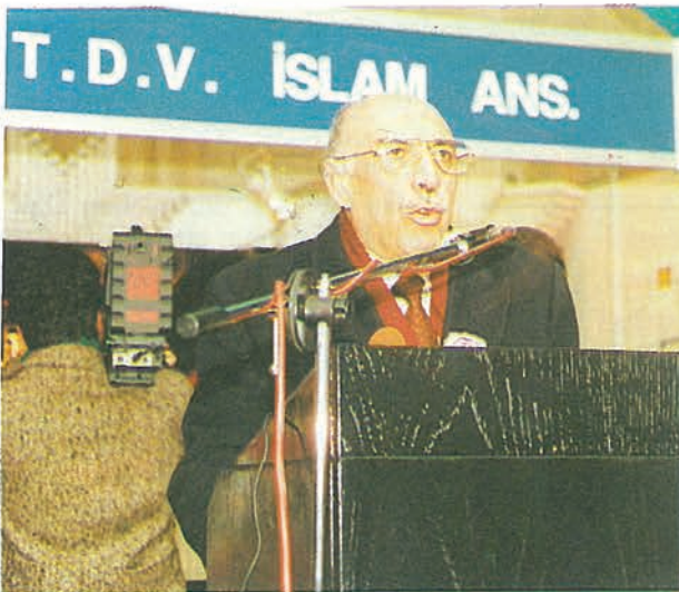
Devlet Bakanı Ekrem Ceyhan

Bu fuar, iştirak eden yayınevleri ve teşhir ettikleri kitaplarıyla Türkiye'de dinî-millî kültürdeki canlanmanın sağlam bir ölçüsünü vermektedir. Dinî-Millî sahada neşriyat yapan yayınevi sayısı ve bu yayınevlerince basılan, okuyucuya sunulan kitap sayısı her yıl hızla artmaktadır. Demek ki, bu kitapların alıcısı olan okuyucu kitlesi çoğalmaktadır. Bu durum başlıbaşına dinî kültürümüzdeki canlılığı gösterir. Aynı zamanda diniyle bütünleşmiş aziz milletimizin, fikir alemiyle olan sıhhatli ve dinamik irtibatına delalet eder. Dinî neşriyattaki bu hızlı artıştan, kimsenin endişelenmesine mahal yoktur. Kötülüğün, belanın kaynağı cehalettir. Cehalet karanlıktır. Kitap ışıktır, aydınlıktır. Kitaptan korkan aydınlıktan korkar. Her medeniyet kitaplar üzerinde yükselmiştir. Medeniyetin sağlam duvarları, birer birer kitaplarla örülür. İslâm medeniyeti zirvede iken, arkasında büyük bir kitap telifi bulunmaktaydı. Dünya tarihinde ortaya çıkmış bütün medeniyetler için bu hüküm şaşmaz ölçülerde doğruyu gösterir. Modern hayat, bir çok geleneğimizi ortadan kaldırdı. Ramazan ayında, iftarla sahur arası caddeler seyrane yerine dönerdi. Şimdi evlerimize hapsoluyoruz. İşte bu fuar, Ramazan geceleri için yeni bir gelenek ihdas ediyor. Kitabın etrafında canlanan bir Ramazan hayatı kadar güzel ne olabilir. Dinî Yayınlar Fuarı, ihdas ettiği bu hayırlı gelenek yüzünden ayrıca takdire şayandır.