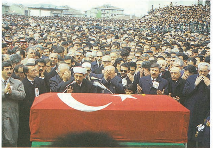
Diyanet İşleri Başkanı Mehmet Nuri Yılmaz tarafından kılınan cenaze namazına onbinlerce vatandaşımız katıldı.

Cumhuriyet döneminde yapılan en büyük cami olan Kocatepe Camii'nin yapımına 1967 yılında başlanarak 1987 yılında tamamlandı. Kocatepe Camii, 28 Ağustos 1987 tarihinde düzenlenen bir törenle dönemin Başbakanı Sayın Turgut Özal tarafından ibadete açıldı. Türk halkının beğenisini kazanan Caminin açılış töreninde duygularını dile getiren Sayın Turgut Özal şunları söyledi; "Bu güzel eseri açmaktan duyduğum gurur diğer eserleri açmaktan daha fazladır."