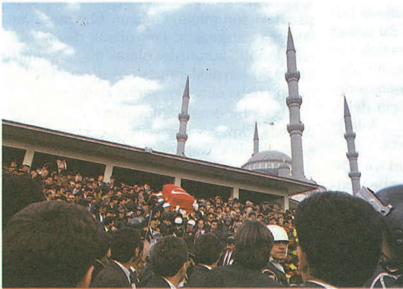
8. Cumhurbaşkanı Turgut Özal'ın naaşı tekbir sesleri arasında son yolculuğuna Kocatepeden uğurlandı.

"Bu güzel eser Türkiye Cumhuriyeti devrinde yapılmıştır. İstanbul'da Sultanahmet, Ankara'da Kocatepe Camii iman edenlerin göğesini kalkmış şahadet parmaklarıdır".