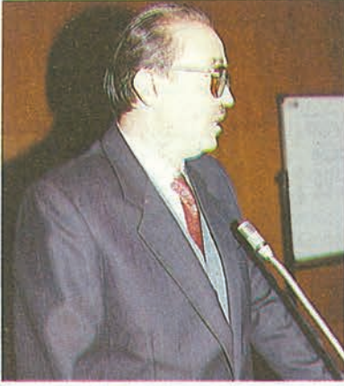
Emekli Diyanet İşleri Başkanı ve Genel Kurul Üyesi Dr. Tayyar Altıkulaç

Emekli Diyanet İşleri Başkanı Dr. Tayyar ALTİKULAÇ, yeni seçilen Mütevelli Heyetin kurul zabıtlarını etraflıca okumalarını, burada belirtilen hususların unutulmaması gerektiğini, Denetleme Kurulunun çalışmalarını yetersiz bulduğunu belirtti. Denetleme Kurulunun, Mütevelli Heyetin yanlışlarını bulup düzeltmesini ve kendilerine rehberlik etmesini istedi. Vakfa devamlı gelir temini için geçmişte temenniler olduğunu, Vakfın mevcut şirketlerinin daha fonksiyonel hale getirilmesinin uygun olacağını, ayrıca yeni Mütevelli Heyetin tazelci olmamasını, iş yükünü dağıtarak işlerin sağlıklı bir şekilde yürütülebilmesi için konunun uzun