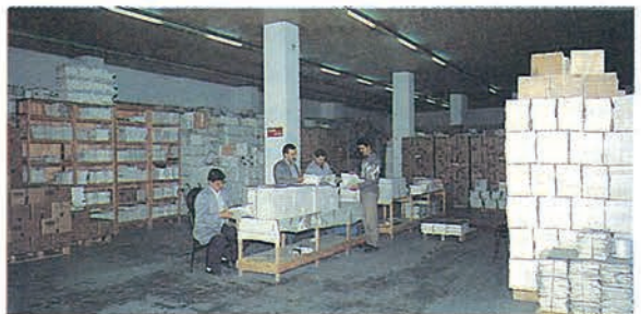
▲ Ansiklopedi depo binasının içten görünüşü...

Gelecekteki hedeflerimiz başta, ansiklopedimizin abone ve satışını daha üst seviyelere çıkarmaktır. İmkanlarımız ölçüsünde ansiklopedimizin baskı ve cilt işlemlerini kendi ünitelerimizde gerçekleştirmek arzusundayız. Bunun için çalışmalarımız devam etmektedir. Hedefimiz, birbiriyle ahenkli, çalışkan ve vakıf ruhuna haiz personelimizle, vakfımız yayıncılığını daha ileri seviyelere çıkarmaktır.