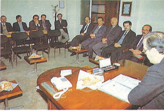
▲ İlim Heyetleri toplantı halinde...