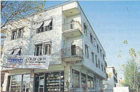
▲ İslâm Ansiklopedisi İdare Binası

Bilindiği gibi, müslümanlar Allah'ın kitabı ve Hz. Muhammed'in (S.A.V) sünnetini esas alarak, geçmişte dünyanın en parlak uygarlığını kurmuşlar, insanlığa akılları ve gönülleri aydınlatan büyük ve eşsiz bir kültür hazinesi sunmuşlardır. Dünyanın diğer milletlerine karşı ilimde,