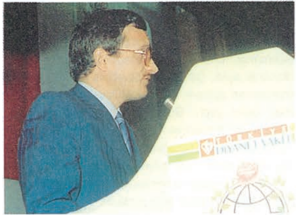
▲ Diyanet İşleri Başkanı Prof. Dr. M. Said Yazıcıoğlu da bir konuşma yaptı.

tası" programının önemi de buradan kaynaklanmaktadır. Peygamberler silsilesinin insanlara benimsetmeye çalıştıkları "güzel huylar"ı kastederek; "Ben güzel ahlâkı tamamlamak üzere (peygamber olarak) gönderildim" buyuran Sevgili Peygamberimizin, gerçekten "güzel ahlâk" la yoğurulmuş hayat tecrübesini tanımaya, ondan yararlanmaya, her zaman olduğu gibi, bugün de çok muhtaç değiliz mi? Günümüz müslümanları, hatta İslâm ülkeleri arasındaki kargaşa ve kaos, buradan kaynaklanan nice insanların ızdırabı, Hz. Peygamber'in güzel ahlâk ve hayat felsefesinden nasibini alamamış bazı insanların karar ve uygulamalarında aranmalıdır. Sevgili peygamberimizin doğumu vesilesiyle kutlanan bu haftanın, peygamber