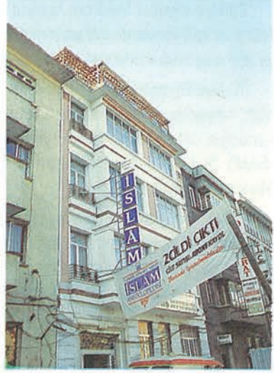
▲ Vakıf Yayınları İşletmesi Hizmet Binası

geçilir. Basılan formlar kırırma verilir. Kırılan formlar harmanlanarak fasikül kapağı içerisine konur. (Şu an bir fasikülde 5 forma bulunmaktadır.) Poşetlendikten sonra fasikül olarak satılmak üzere dağıtım ve kitapçıya gönderilir.