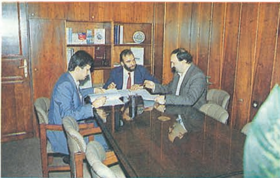
▲ İşletme Yöneticileri toplantı halinde

Ansiklopedimizin dağıtımı iki şekilde yapılmaktadır. Bunlardan birincisi PTT yoluyla ikincisi ise, şubelerimiz yoluyla. Birinci cildin dağıtımında her iki yolla birbirine yakın oran da dağıtım yapıldı. Bu sene ikinci cildin dağıtımında postadaki kaybolmalar ve yıpranmalar düşünüldükten şubeler yolu ile dağıtıma ağırlık verdik. Anadolu da bu sistem çok güzel uygulandı ve sonuç alındı. Yalnız Ankara ve İstanbul gibi nüfusu fazla olan büyük ille- rimizde bazı problemler oldu ise de alınan yeni tedbirlerle bu problemler halledilecektir. Dağıtım konusunda bugüne kadar ciddi bir sıkıntı olmadı. Az da olsa adres değişikliğinden ve bilgi eksikliğinden ciltler iade olmakla birlikte abonemizin talebi üzerine yeni adresine taahhütlü olarak gönderilmektedir.