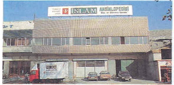
▲ Mülkiyeti Vakfımıza ait Ansiklopedi depo binası

Bunun yanında aynı kampanyayı eğitim ve öğretim kurumlarımıza duyurma faaliyetlerimiz devam ediyor. Ortadereceli okullardaki tüm din ve ahlak bilgisi öğretmenlerine bu kampanya duyurulmuştur. Diğer öğretmenlerimize de duyurulmaya devam edilmektedir. Ayrıca "En iyi hediye kitaptır" düşüncesinden yola çıkarak büyük kuruluşların yıl başlarında ve özel günlerde çalışanlarına kitap hediye etmelerini sağlamak amacıyla çalışmalar başlattık. Önümüzdeki günlerde belirli illerde bölge temsilcilikleri açma teşebbüsümüz vardır. Bununla okuyucularımızla daha yakından ilişki içerisine girmeyi amaçlıyoruz.