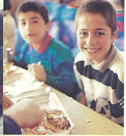
Bütün çocuklar hep böyle gülebilseler...