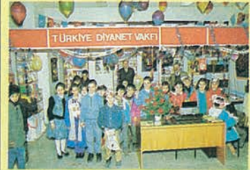
Çocuk Dünyası '90 Fuarında Vakfımızın standı çocukların büyük ilgisini çekti.

Vakfımız Yayın-Matbaacılık ve Ticaret İşletmesi 20-24 Nisan tarihlerinde açılan "I. Ankara Çocuk Dünyası'90 Fuarı"na özel bir reyon hazırlayarak iştirak etti. 23 Nisan dolayısıyla düzenlenen fuara özellikle çocuklara yönelik faaliyet gösteren 25'in üzerinde firma katıldı. 23 Nisan'da ülkemize gelen dünya çocuklarının da ziyaret ettiği fuarda Vakfımız da çocuklarla ilgili neşriyatını ve İslâm Ansiklopedisini teşhir etti.