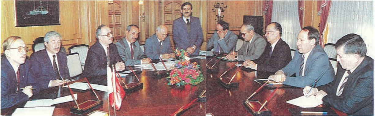
Suriye'den gelen Heyet Diyanet İşleri Başkanlığı yetkilileri ile toplantıda.

Suriye heyeti; Türk hacı adaylarının geçişlerinde her türlü kolaylığın gösterileceği, konaklama yerlerinde ve yol güzergahlarında her türlü güvenliğin sağlanacağı konularında teminat verdi. Ayrıca bu yıldan itibaren Türkiye'den Hatay, Cilvegözü, Suriye'de Babu'l Hava'dan geçişin yanı sıra ikinci kapı olan Türkiye'de Gaziantep Öncüpinar'dan, Suriye'de Babu'l Selame'den geçiş yapılacaktır. Her iki sınır kapısında konaklama yerlerinde sağlık merkezleri kurulacaktır.