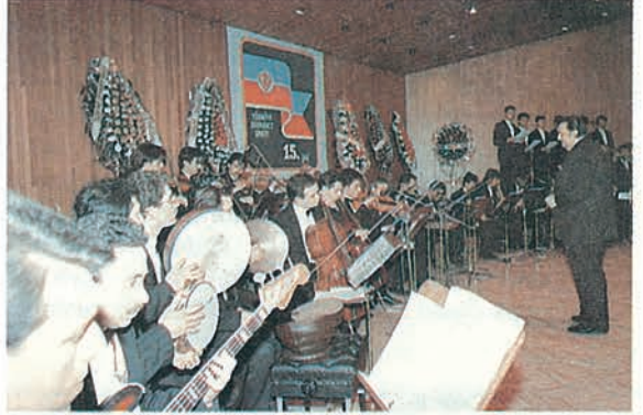
İstanbul Konseri'nden bir an...

Zevkle izlenen ve defalarca ayakta alkışlanan Yıldırım Gürses ve ekibinin konserinden sonra büyük sanatçı ve bestekar Yıldırım Gürses de ifadelerini şöyle dile getirdi: " Musiki bir ülkenin kültürünün kaçınılmaz parçalarından bir tanesidir. Musiki, bir ülkenin zevkini, güzelliğini, haysiyetini, şuurunu geleceğe en güzel aktaran olaylardan bir tanesidir. Musiki hiçbir zaman bir eğlence olayı değil, bir mesaj olayı, bir ulaşma olayıdır. Biz bunu böyle bildik. "