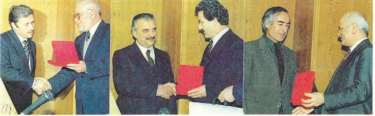
Vakfımız Adana Şubesi çalışmalarına katkılarından dolayı Adanalı hayırseverler Vakfımızca ödüllendirildiler.