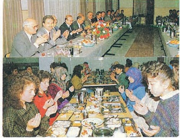
Kastamonu Kız Öğrenci Yurdu'nda verilen iftar yemeği