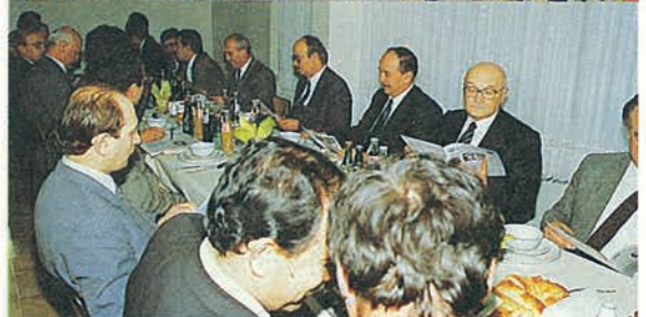
Kardeş Vakıflarla Vakfımız yemekhanesinde yenilen iftar yemeği