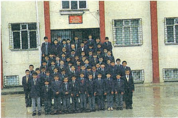
Vakfımızca Mersin'de Türkiye'de okutulan K.K.T.C. 'li öğrenciler : "Türkiye Diyanet Vakfı'na müteşekkirimiz. Bu hizmete layık olmaya söz veriyoruz."

Kuzey Kıbrıs Türk Cumhuriyeti'nde yaşayan fakir aile çocukları Vakfımız desteğinde Türkiye'de okutuluyor.