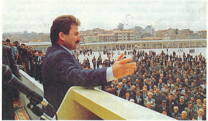
Ankara Fuarı'nın açılışında Kültür Bakanı Namık Kemal Zeybek de bir konuşma yaptı.