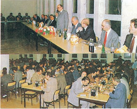
Konya Erkek Öğrenci Yurdu'nda verilen iftar yemeği