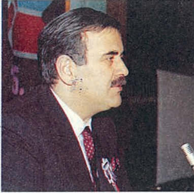
Devlet Bakanı Mehmet KEÇECİLER

İnsanların dinî hayatını tanzim etmek, aslında cemiyet olarak huzur içerisinde, şükür içerisinde yaşamamızın temel esaslarından bir tanesidir. Ne zaman bu anlayışı terkettik, ne zaman helâli haramı bilmeyen bir nesil yetiştik, ne zaman hakk'ı hak olarak bilip ona ittiba eden nesillerden uzaklaştırdık, memleketi o zaman sıkıntıya düşürdük, o zaman felakete düşürdük, o zaman memleketi idare etmek fevkalade zorlaşmıştır. Biz onun için gönüllerinde inanç taşıyan, yaptığı her hareketin hesabını vereceğine inanan nesiller yetiştirdiğimiz müddetçe toplumumuzu huzura, şükran ve kalkınmaya doğru götüreceğimize inanıyoruz. Bu manada Diyanet İşleri Başkanlığımıza bütçe kaynaklarımızdan ayırdığımız imkanları çoğaltmanın gayreti içindeyiz. Nitekim bütçe rakamları incelendiğinde bu açıkça görülecektir. Vatandaşımız kendi camiindeki imamının parasını ödemek zorunda bırakılırsa, kendi Camiini kendin yap denirse, kendi Kur'an kursunu kendin yap denirse ve hemen hemen sadece mevcut kadroları devlet bütçesinden öderiz, diğerlerine karışmayız gibi bir anlayışla ortaya çıkılırsa o zaman milletimiz ortaya çıkar, inançlarını ortaya koyar, Vakıflar eliyle yardımcı olur. Bizim burada gördüğümüz husus milletin inançlarına sahip çıktığının bir ifadesidir, Devlet-Millet işbirliğidir.