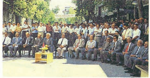
Adana Yayinevinin açılışında davetliler...

T.A.V. nın bir mensubu olarak değil bu milletin bir ferdi olarak bu özlemi, içten duymuş bu bekleyişi günlerce aylarca yıllarca yaşamış ve bunun hasretini çekmiş bir insanım. Ve bu bakımdan Adana'da ve diğer illerimizde dinî neşriyatın, sağ neşriyatın, millî neşriyatın, millî kültürün, memleket gençliğinin