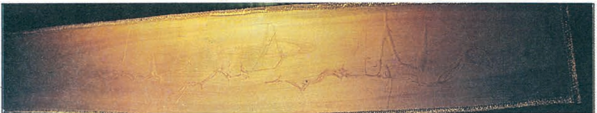
Üzerinde tabii olarak "Bismillahirrahmanirrahim" ve "Muhammed" yazan ağaç levha

Hat sergisinin bir diğer özelliği de kamuoyunda büyük ilgi gören ve Afrika ormanlarından kesilip ülkemizde bir kaplama fabrikasında işlenirken farkedilen ve üzerinde "Bismillahirrahmanirrahim" ve "Muhammed" yazan ağaç levhanın sergilenmesiydi. 40 metre boyunda olan ve 4'er metrelik tomruklar haline getirilen ağacın üzerindeki yazı, Tomruklar Ankara'da bir kaplama fabrikasında 1'er milimetrelik incelikte doğranırken farkedilmiş ve kamuoyunda büyük ilgi görmüştü.