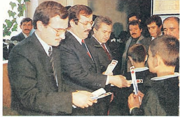
Vakfımızca 1. Sağlık Taraması'na bağışlanan diş fırçalarının dağıtımına Gülveren İlkokulu'nda yapılan törenle başlandı.

Ankara Valisi Saffet Arıkan Bedük de yaptığı konuşmada; Sağlık Taraması ile ilgili Ankara il ve merkez ilçelerinde yapılan uygulamalardan söz ederek Türkiye genelinde yapılan 1. Sağlık Taramasında en büyük başarıyı Ankara'nın elde ettiğini ifade etti. Vali Bedük daha sonra şöyle dedi :