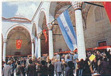
Ankara Fuarı'ndan bir görüntü...

gerçeğe daha değinmek istiyorum. İslâm medeniyetinin yüksek olduğu noktalarda her İslâm şehrinde onbinlerce kitabı olan kütüphaneler vardı. Avrupada ise bin kitaba sahip olan hükümdar parmakla gösteriliyordu. Şimdi ise öyle değil.