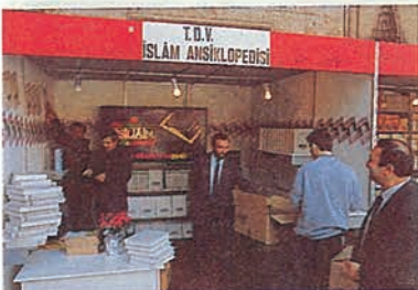
İstanbul Fuarında İslam Ansiklopedimiz de ayrı bir standda teşhir edildi.