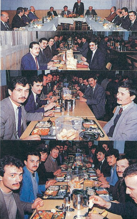
Mütevelli Heyetimiz Vakıf personelimiz ile iftar yemeğinde