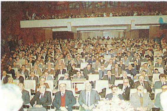
"İlmi Toplantı" da dinleyiciler

Bugün Türkiye'de din eğitimi programlarının tatmin edici olduğunu söylemek biraz zordur; Fakat din derslerinin mecburî olmasıyla çoktan beri