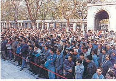
İstanbul Fuarı'nın açılış konuşmasını dinleyen ziyaretçiler.

Halkımıza Ramazan ayıyla birleşen ve Ramazan ayını daha da güzelleştiren 8. Dini Yayınlar Fuarı'nın hayırlı olmasını diler, Türkiye Diyanet Vakfı yöneticilerini candan tebrik ederim.»