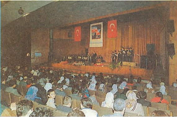
Ankara Konseri'nden bir an...

Bu memleket daha çok güzel günler görecektir. bu millet büyük millettir. Bu toprağın bağrında milyonlarca şehit var, mühim olan o şehitlerin emanetine sahip çıkabilmektir, çıkmak mecburiyetindeyiz. Biz burada sadece bir gece yaşamadık. Türk'ün kültürü yok diyenlere, Türk'ün musikisi yok diyen zangoçlara da bir cevap verilmiş oldu."