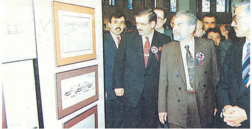
Hat Sergisi'nin açılışını Devlet Bakanı Mehmet Keçeciler yaptı.