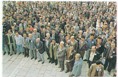
Ankara Fuarı'nın açılışı büyük ilgi gördü.