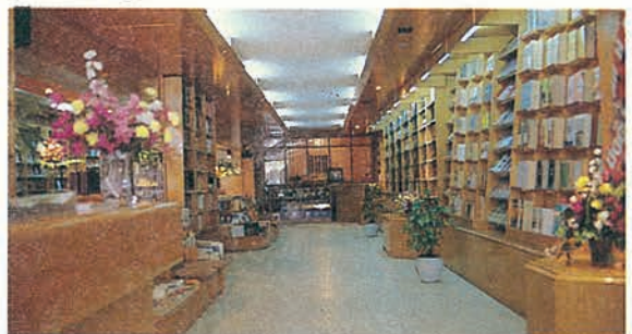
Adana Yayinevimiz 460 m 2 kullanım salonuna sahip modern bir kültür yuvası

Bu konuşlardan sonra Adana Yayinevimiz Mütevelli Heyet Başkanımız Halit Güler tarafından hizmete açıldı.