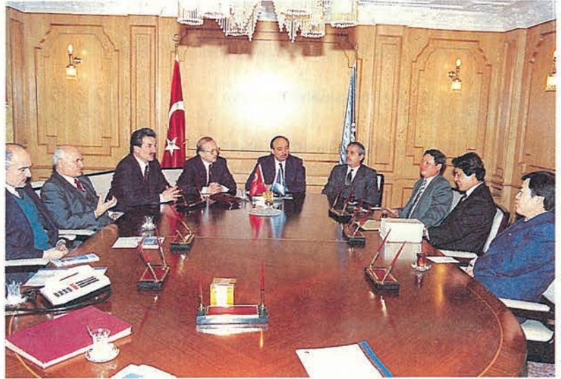
Kore Heyeti ile Mütevelli Heyetimiz toplantı esnasında...